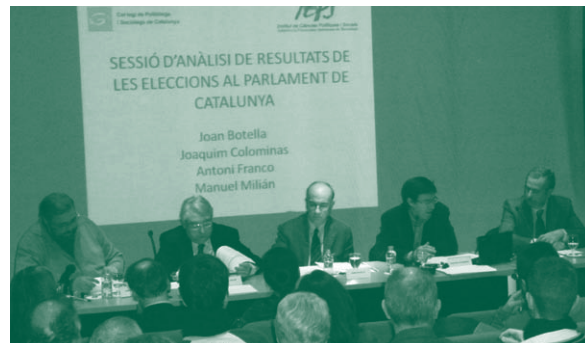
Anàlisi de resultats electorals al Parlament de Catalunya 2010