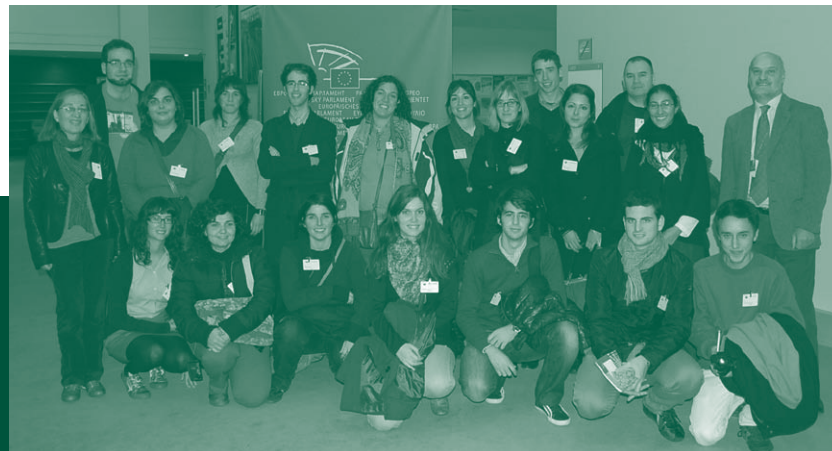
Un grup de col·legiats al Parlament Europeu, Brussel·les