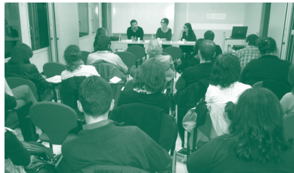
Taula rodona d'anàlisi de les revoltes al món àrab