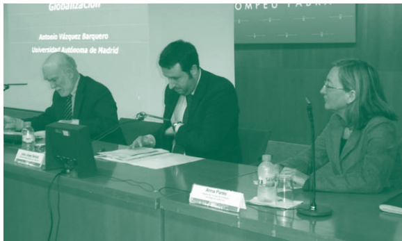
Jornada "Fem Xarxa"