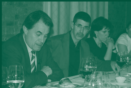
Artur Mas durant un sopar amb col·legiats

El Col·legi organitza sopars col·loqui entre els seus col·legiats i els representants polítics del moment, en un ambient distès on els convidats debaten de tu a tu qüestions d'actualitat amb els polítics convidats